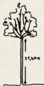
Tige / Demi-tige

Les fruitiers en Scions et en Quenouilles sont plus faciles à tailler, plus pratique dans les jardins de petites et moyennes tailles et sont conseillés pour une récolte rapide des fruits.